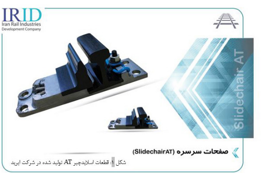
شکل ۱: قطعات اسلایدچیر AT تولید شده در شرکت ایرید