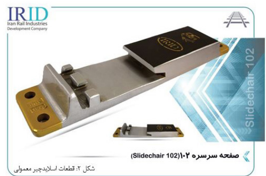
شکل ۲: قطعات اسلایدچیر معمولی