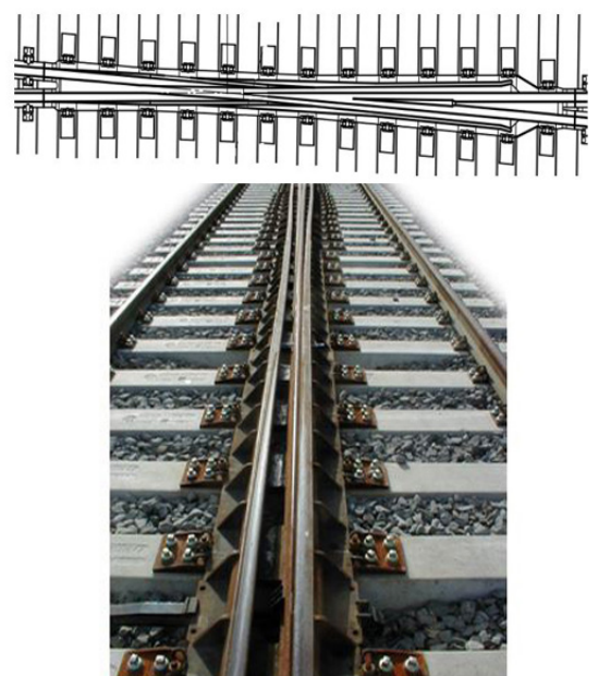
شکل ۴: سوزن با تکه مرکزی بدون زیر فراگ و قطعه کراس استاپ