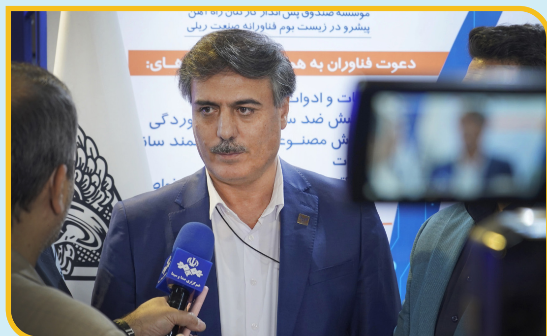
موسسه صندوق پس انداز کارکنان راه آهن پیشرو در زیست بوم فناوریانه صنعت ریلی

او در ادامه با بیان اینکه مبنای تشکیل مؤسسه که همان منتفع بودن بیشتر اعضا از درآمدهای مؤسسه بوده، به واقعیت نزدیک شده است. افزود: امروز از