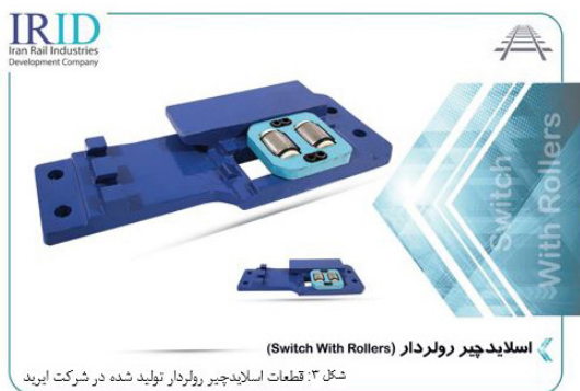
شکل ۳: قطعات اسلایدچیر رولردار تولید شده در شرکت ایرید

سرعت حمل و نقل ناوگان ریلی در کشور ما در مقایسه با سایر راه های حمل و نقل جاده ای، دریایی و هوایی و همچنین در مقایسه با کشورهای توسعه یافته بسیار پایین می باشد. علی رغم دارا بودن ظرفیت و پتانسیل های فراوان برای بر عهده گرفتن بخش عظیمی از حمل کالا و مسافر در این بخش تا کنون توجه ویژه ای به این صنعت نشده است. همچنین عدم استفاده از سیستم های پر سرعت در خطوط ریلی منجر به افزایش هزینه های تعمیر و نگهداری و حتی تعویض قطعات گشته است. امروزه در دنیا با پی بردن به اهمیت حمل و نقل ریلی، سرمایه گذاری های عظیمی در این حوزه در کشورهای توسعه یافته و حتی در حال توسعه و کشورهای حاشیه خلیج فارس انجام یافته است. به گونه ای که سرعت های ۳۰۰ الی ۶۵۰ کیلومتر بر ساعت را در این کشورها می توان مشاهده نمود. در حالیکه سرعت عبوری ناوگان ریلی در کشور ما در بهترین وضعیت مابین ۸۰ الی ۱۲۰ کیلومتر بر ساعت می باشد. امروزه با پی بردن به ظرفیت های بالای حمل و نقل